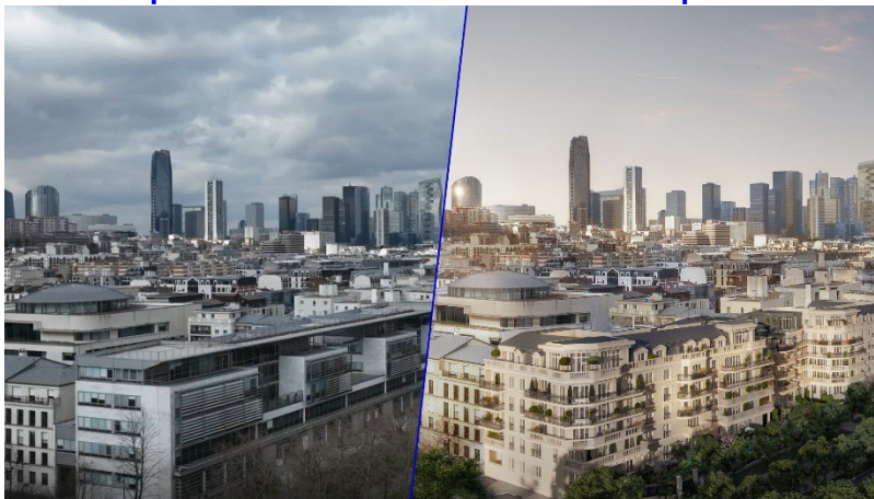
Vue avant et perspective après de l'immeuble © La Fabrique Perspective

Situé Quai De Dion Bouton, à proximité de Paris, de l'Île de Puteaux et du bois de Boulogne, ce nouveau projet vise à recycler un immeuble de bureaux obsolète d'une superficie de 6 500 m 2 , dans un secteur très recherché pour le résidentiel.